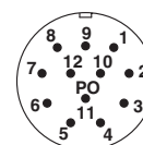
Przyłącze wtykowe M23 wtyk, 12-polowy