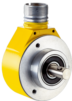
Rysunek może się różnić