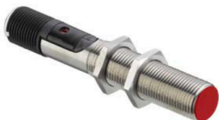
Art.-Nr.: 50135693 LCS-1M12M-F04PNC-K020P Sensor kapazitiv