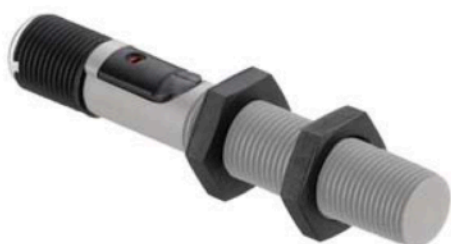
Art.-Nr.: 50135701 LCS-1M12P-F04PNC-K020P Sensor kapazitiv