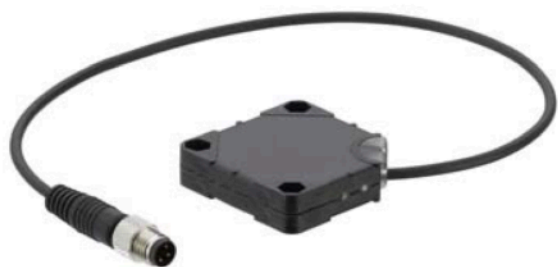
Art.-Nr.: 50135742 LCS-1Q40P-F20BNP-K020P Sensor kapazitiv