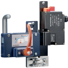
ID: kazm1f25 | 498,2 kB | .jpg | 352.778 x 352.778 mm - 1000 x 1000 px - 72 dpi | 36,5 kB | .png | 74.083 x 74.083 mm - 210 x 210 px - 72 dpi